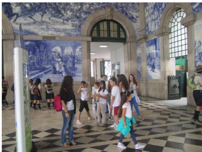
Na Estação de São Bento, no Porto

Durante este mês de julho estão a decorrer as atividades de ocupação de tempos livres promovidas pela Associação Social e Cultural de Sobreposta. Os jovens que nelas participam têm realizado e irão realizar atividades bastante diversificadas, entre as quais estão incluídas maratonas de fotografia, pedy papers , uma ida ao cinema, visita a museus, ao centro histórico do Porto e a Guimarães, uma ida à praia, encontros de prática desportiva, uma ida à piscina de Sobreposta e um atelier de teatro.