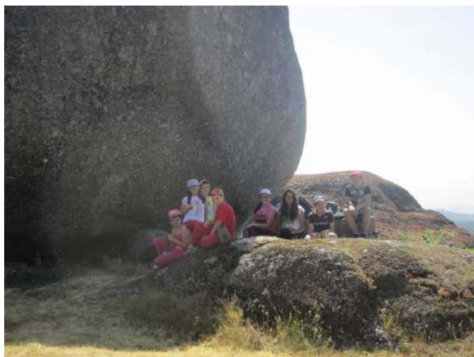
Lanchando na Pena

Durante este mês de julho estão a decorrer as atividades de ocupação de tempos livres promovidas pela Associação Social e Cultural de Sobreposta. Os jovens que nelas participam têm realizado e irão realizar atividades bastante diversificadas, entre as quais estão incluídas maratonas de fotografia, pedy papers , uma ida ao cinema, visita a museus, ao centro histórico do Porto e a Guimarães, uma ida à praia, encontros de prática desportiva, uma ida à piscina de Sobreposta e um atelier de teatro.