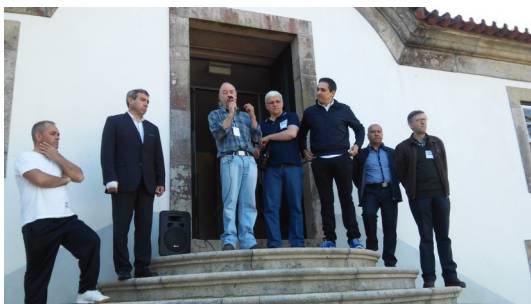
Diversos representantes das entidades que organizaram a Caminhada