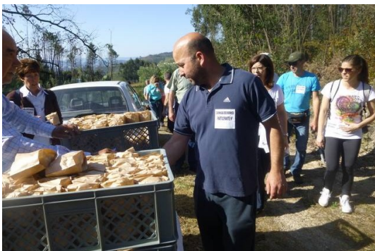
Momento do abastecimento, em que todos aproveitaram para retemperar forças