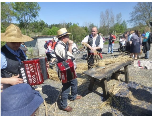
Fantástica receção, na eira coletiva em Lageosa (Sobreposta)