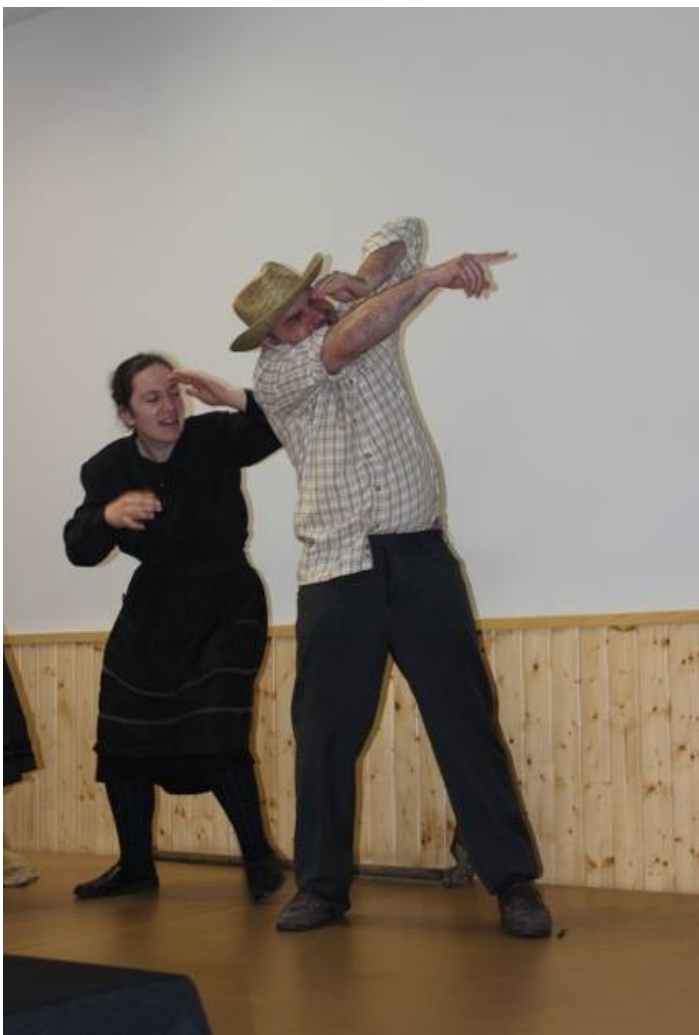
Teatro Planalto representando “Um OVNI na Igreja Velha”