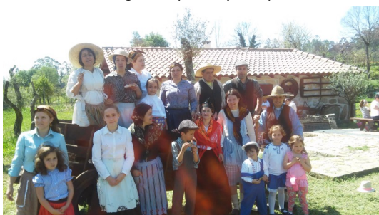
O almoço convívio decorreu nos Moinhos da Tojeira, em Sobreposta

O dia 12 de abril ficará na história dos moinhos dos rios Torto e Febras. Com efeito, nesse dia houve um congregar de vontades em torno da sua recuperação, ao pretendermos assinalar o Dia dos Moinhos.